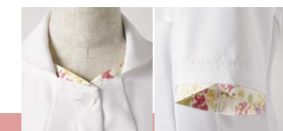
襟元や袖口などにあしらわれた花柄のポイントが白衣に上品さとかわいらしさをもたらします。

院内はまるでホテルのようなラグジュアリーな雰囲気。英国のライフスタイルブランド「ローラ アシュレイ」の、優雅で上品なインテリアによって、医療施設であることを感じさせない、心安らく「おもてなし空間」が実現しています。また、ユニフォームも同じブランドで統一。清潔感あふれる白をベースに、ローラ アシュレイならではの花柄をあしらったエレガントなウェアが、スタッフの笑顔や華やかに彩り、来院者の緊張をほくしています。